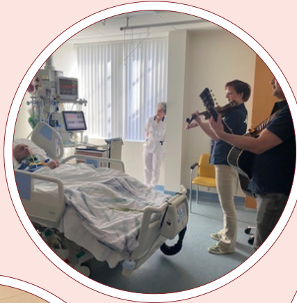
Music op de IC