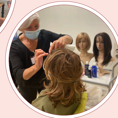
Workshops Look Good Feel Better