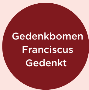
Gedenkbomen Franciscus Gedenkt