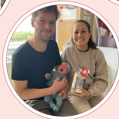
Aandacht voor patiënten op bijzondere dagen