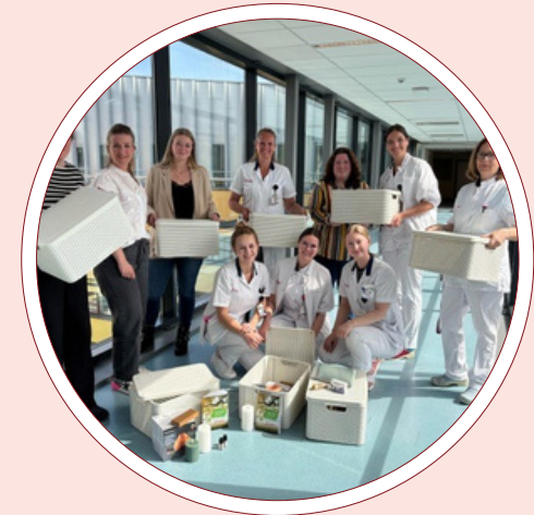
Waakmanden Palliatieve patiënt